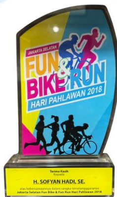
Fun Bike & Run Kebayoran 2018