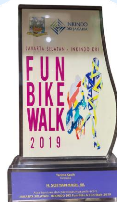
Fun Bike & Run Kebayoran 2019