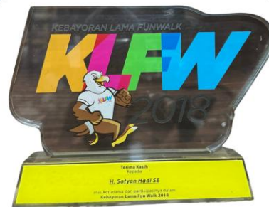
Fun Walk Kebayoran 2018