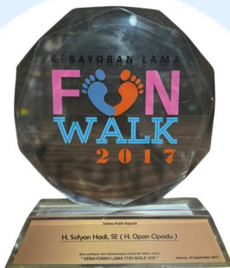
Fun Walk Kebayoran 2017